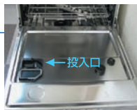
専用粉末洗剤が使えます。

汚れの程度が普通で血液汚れが少ない場合に、除菌なしで洗うだけのプログラムです。洗浄:60°C 最終すすぎ:65°C